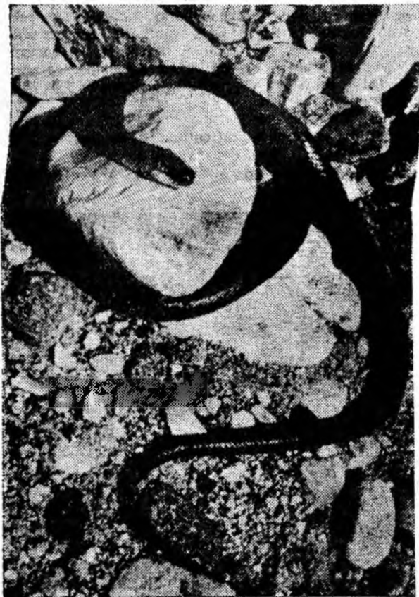
IL DOARE CAPUL ȘI CAUTA DRUMUL MARE? CINE ȘTIE!

● La Bombay s-au încheiat recent lucrările de construcție a celei mai înalte clădiri din oraș — un bloc cu 26 de etaje care a fost denumit „Usha Kiran”, ceea ce înseamnă „Razele răsăritului de soare”. Aceasta este și cea mai înaltă clădire nu numai din India, ci și de pe întreg continentul asiatic.