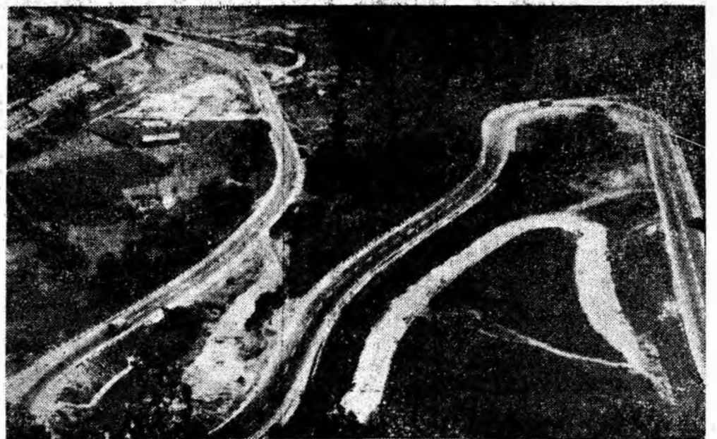
SERPENTINA DE LA BOLII