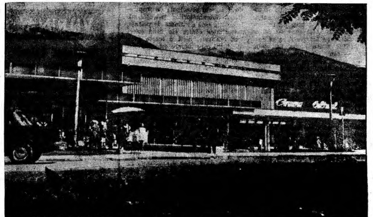
Un punct de atracție în orașul Lupeni: cinematograful „Cultura”.