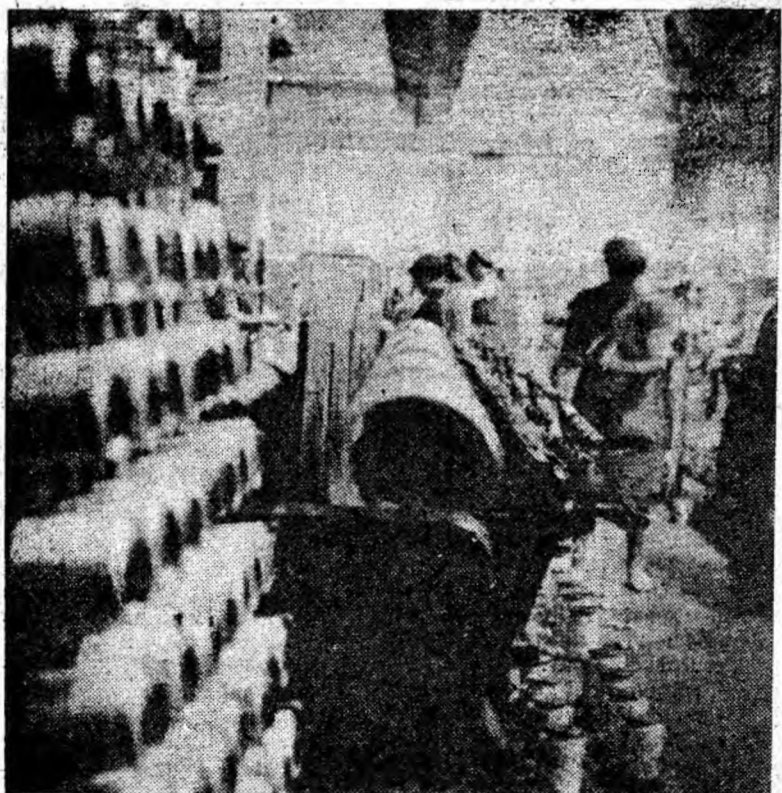
Fotografia înfățișează un aspect din secția depănării la F.F.A. Viscoza din Lupeni. În această secție firul de mătase trece printr-o operație tehnologică de bază pe care hărnicele filatoare o îndeplinesc cu pricepere și conștiinciozitate.

Lupeni cu 34,4 m l, Aninoasa — 24 m l, Paroșeni — 23,3 m l, Lonea — 17,3 m l, Uricani — 13 m l, iar Vulcan cu — 10,4 m l. Astfel, pe bazin minusul pe această decadă este de 170 m l. Din nou, SLAB, tovarăși de la investiții!