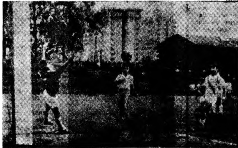
Aspect din timpul meciului dintre Jiul și Steagul roșu Brașov, terminat cu scorul de 2-2.