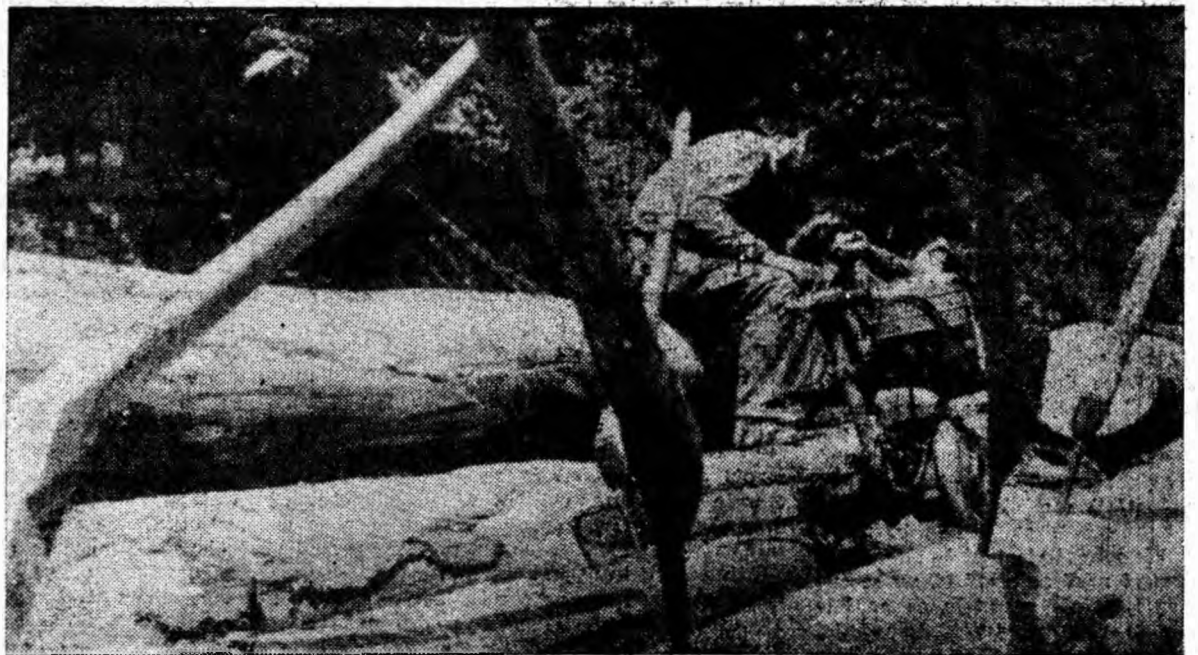
Pauză. Acum se poate fuma liniștit o țigară. Pînă atunci se mai odihnește și... Drujba, aliat de nădejde al muncitorilor forestieri.