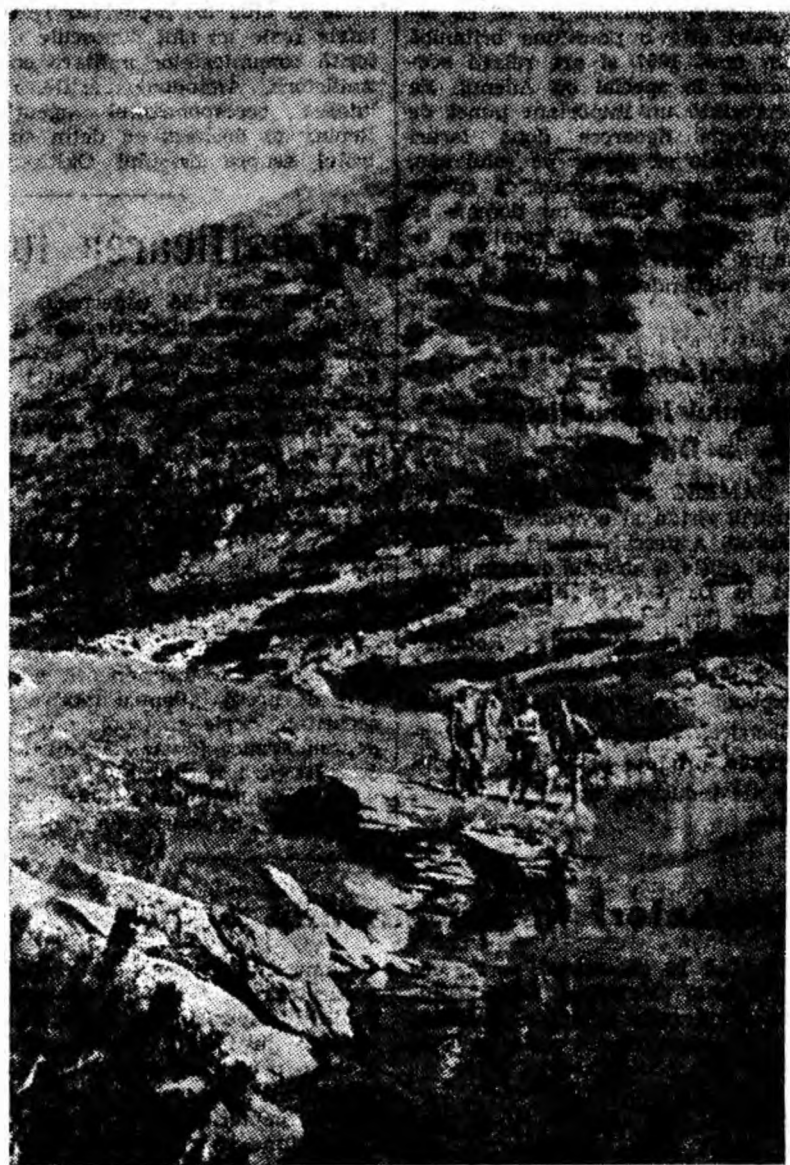
Drumetînd prin munții Retezatului lacurile glaciale invită excursioniștii să le admire și să poposească pe țărmurile lor.