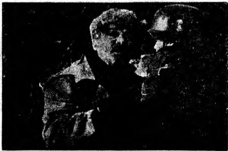
Secvență din filmul „Pe gheața subțire”

La cinematograful „Republica” rulează din 29 august producția sovietică în două serii „Pe gheața subțire”.