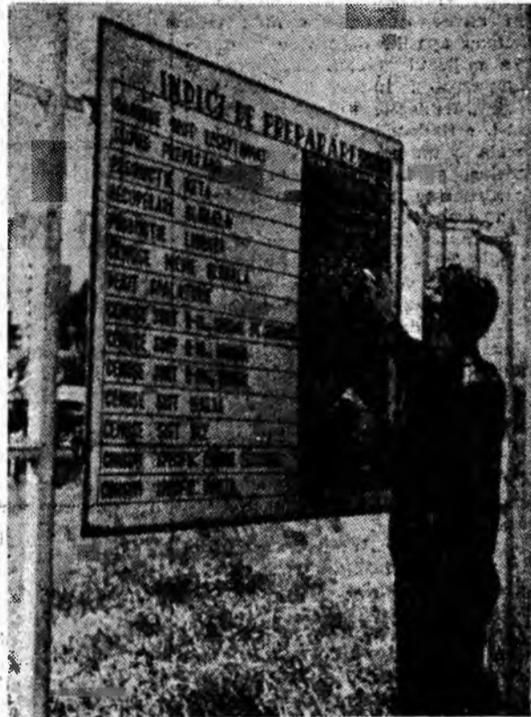
Ultimele rezultate ale întrecerii socialiste de la Prepararea din Coroești după ce-s verificate, sint înscrise pe panoul cu indici aflat în incintă, simbolizând astfel succesele harhicilor preparatori

Fiecare colectiv are datoria de a analiza stadiul îndeplinirii angajamentelor de întrecere și de a asigura aplicarea integrală și neîntârziată a măsurilor și soluțiilor pe baza cărora s-au stabilit noile angajamente!