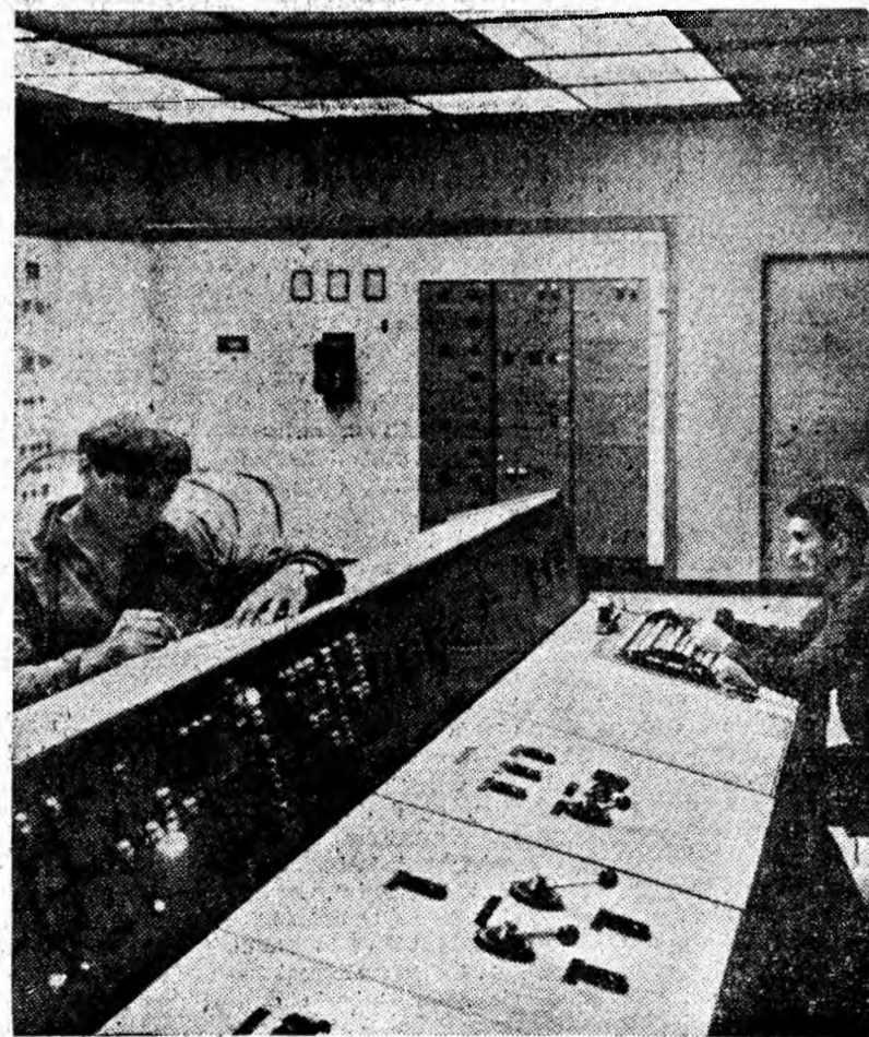
În cabina de comandă a preparației Corocești