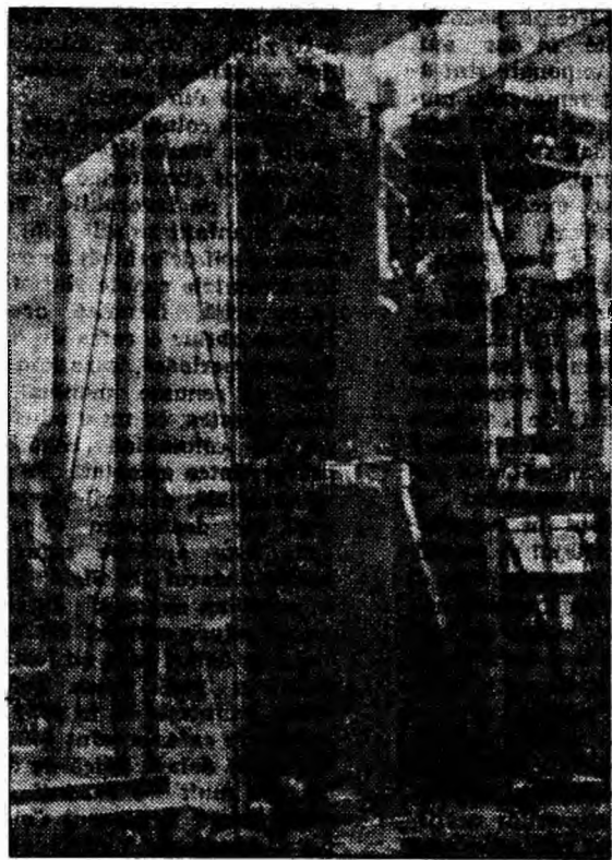
Secția construcției metalice U.R.U.M.P. Se face vopsirea noilor colivii terminate în secție pentru exploatarea miniere