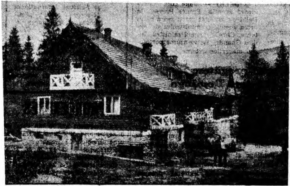
O cabană pitorească într-un loc pitoresc: cabana Cîmpu lui Neag. Cu un transport mai bine organizat va putea găzdui și mai multă animație