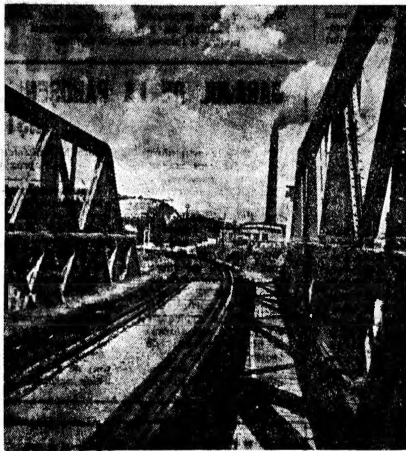
Pod peste Jiu