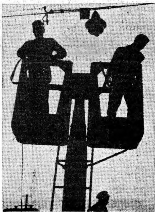
Mașina-macara poposește din loc în loc de-a lungul străzii cu echipa de intervenții pentru a înlocui becurile defecte