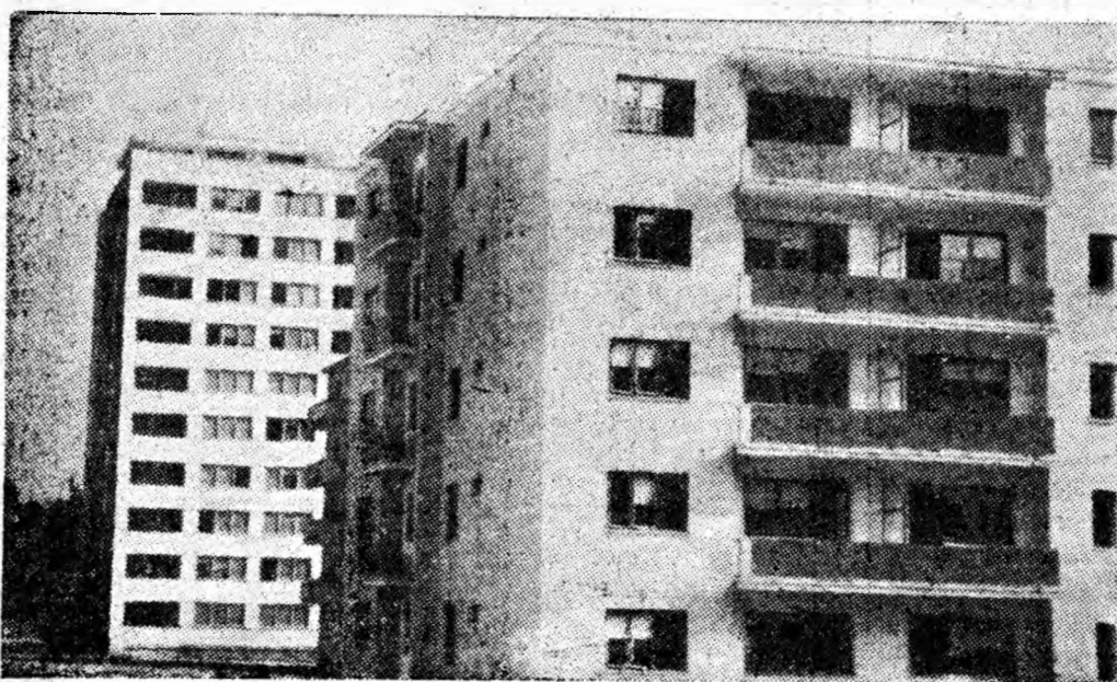
și la Petrila, an de an se construiesc și se dau în folosință noi blocuri.