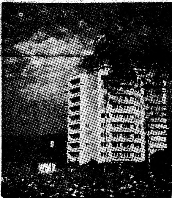
Una din nobile perle urbanistice din microraioul B + C Petroșani.