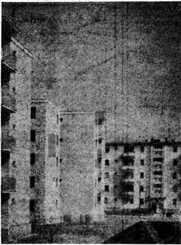
Siluețele svelte ale blocurilor din noul cartier „8 Martie” din Petrila