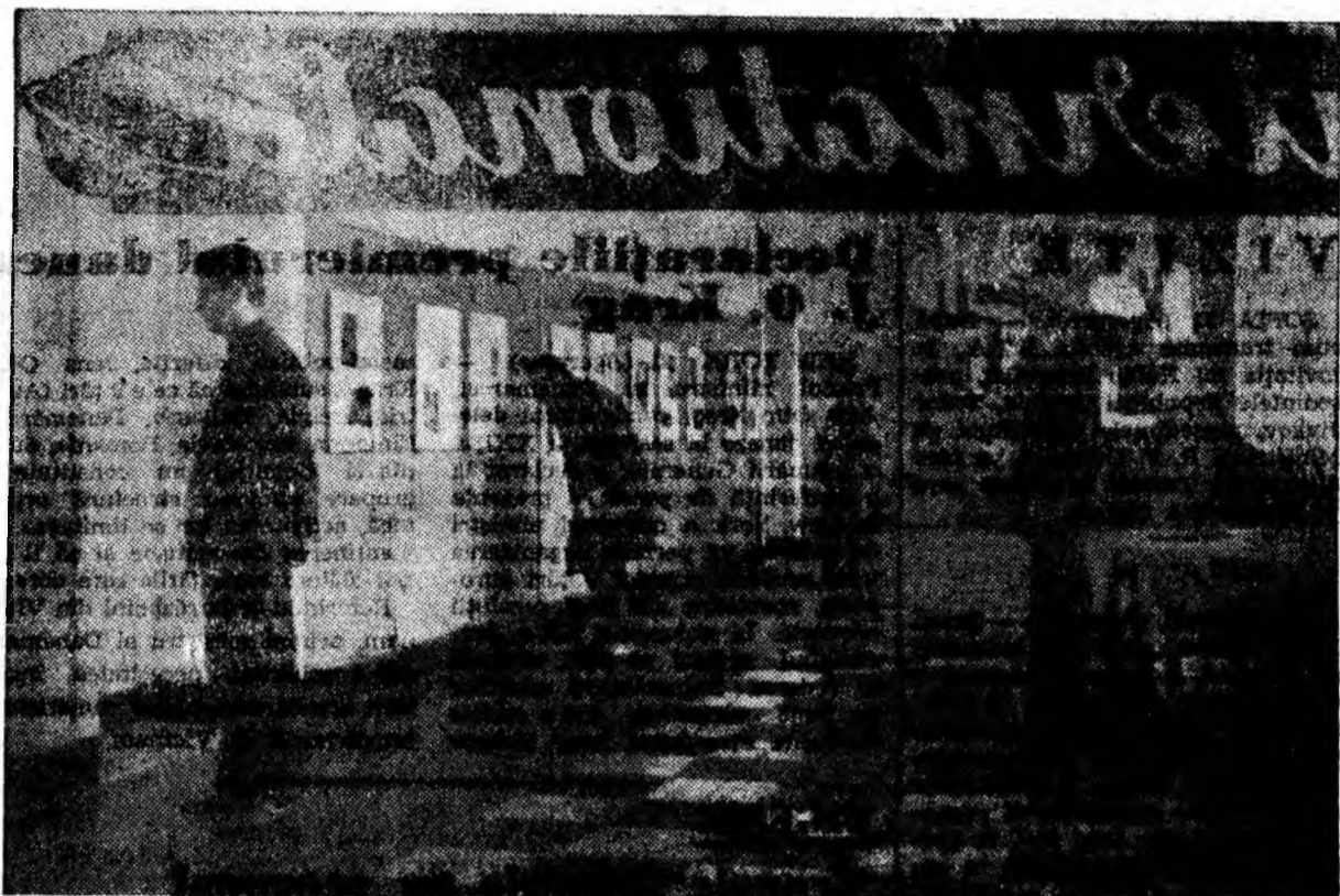
Arta fotografică este îmbrățișată de un număr mare mai larg de amatori. Fotoreporterul nostru a surprins un aspect de la expoziția cercului foto din holul clubului sindicatelor din Lupeni.