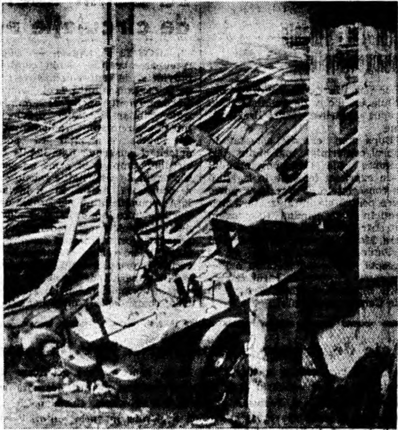
Ceea ce se vede în clișeu nu este opera unui cutremur, ci rezultatul lipsei de spirit gospodăresc a celor ce răspund de materiale și utilaje la E. M. DiIja.