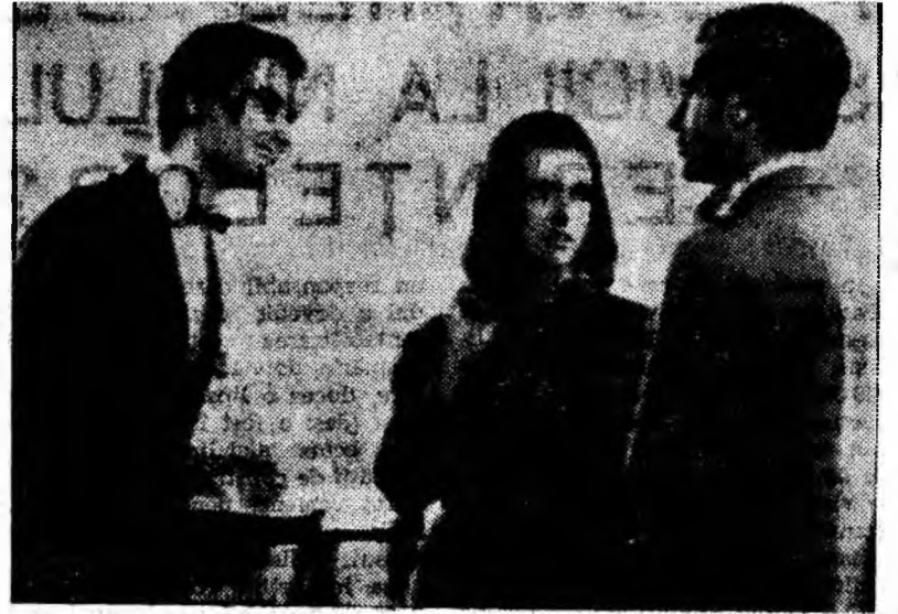
Secvență din filmul „Dragostea mea”

Tînăra Nora, stigmatizată de imoralitatea mamei ei, se îndrăgostește de Mario, bărbat căsătorit și tată al unei fetițe de 10 ani. Nefericit în căsătorie, Mario își părăsește familia; închiriază un apartament în care vrea să trăiască nestingherit împreună cu Nora. Scurta perioadă de furtivitate este intreruptă de vestea dispariției fetiței la care Mario ținea foarte mult. Disperat, aleargă pe străzi s-o caute. O găsește Nora într-un parc și află că fetița plecase de acasă în căutarea tatălui ei. Singura soluție pentru cei doi este să se despărte. Nora își găsește un post de interpretă în străinătate. Redată familiei, Mario se supune hotărîrii ei.