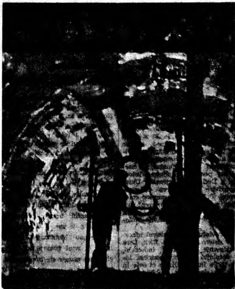
INTERIOR DIN GALEBIA DE COASTĂ DE LA BĂRBĂTENI