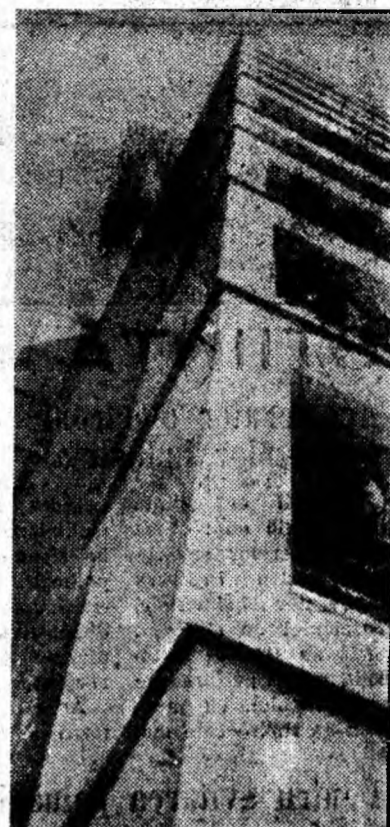
De sus, de pe balcoanele veritabile și gândurile devin mai înaripate.

Anul XIX XXIV Nr. 5578 Simbătă 30 septembrie 1967 4 pag. 25 bani