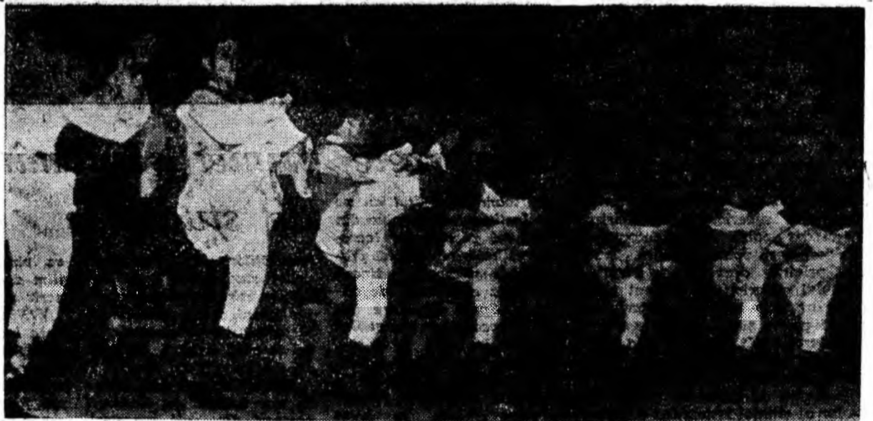
Dansatorii petroșaneni în febra pregătirilor pentru „finalele” artiștilor amatori.