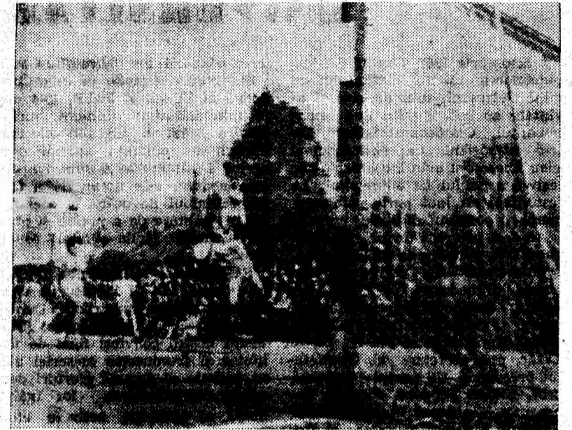
Szolga gitează puternic, dar balonul va întilni bara transversală.

lor care au înscris multe goluri. În această repriză „recolta” a fost de 8 goluri pentru gazde și de numai 2 pentru oaspete. Deci rezultatul final a fost 17—3 pentru Școala sportivă Petroșani, într-un meci în care localnicele au avut o misiune deosebit de ușoară. Rușeștențele au părut ca niște turiste, trebuind să îndeplinească și formalitatea de a se prezenta la