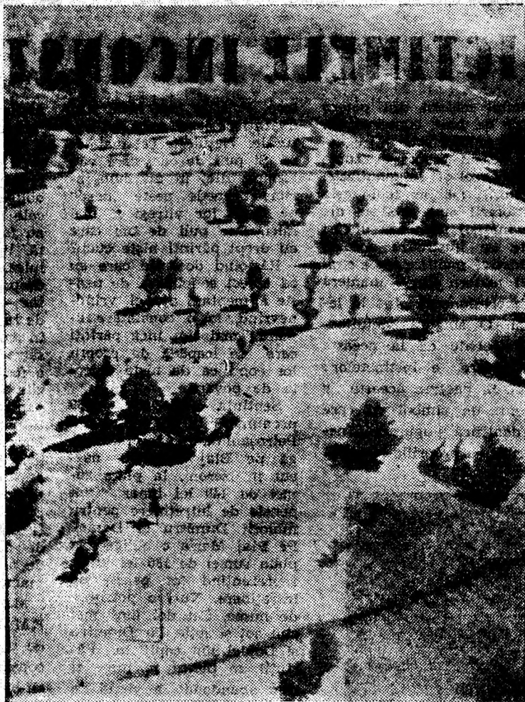
Dealul Babei în veșmînt de toamnă. Cea mai mare podoaabă a sa care-l înfrumusețează vara, iarba, a fost transformată de mâini harnice în fin și depozitată cu grijă în sumedenie de căi și căpițe.