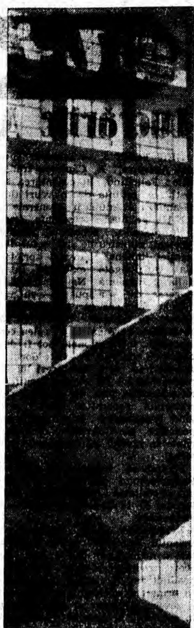
Pe scări spre apartament