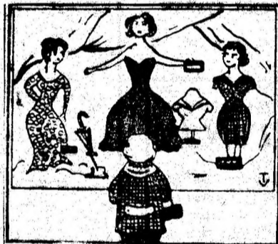
văzută de soție