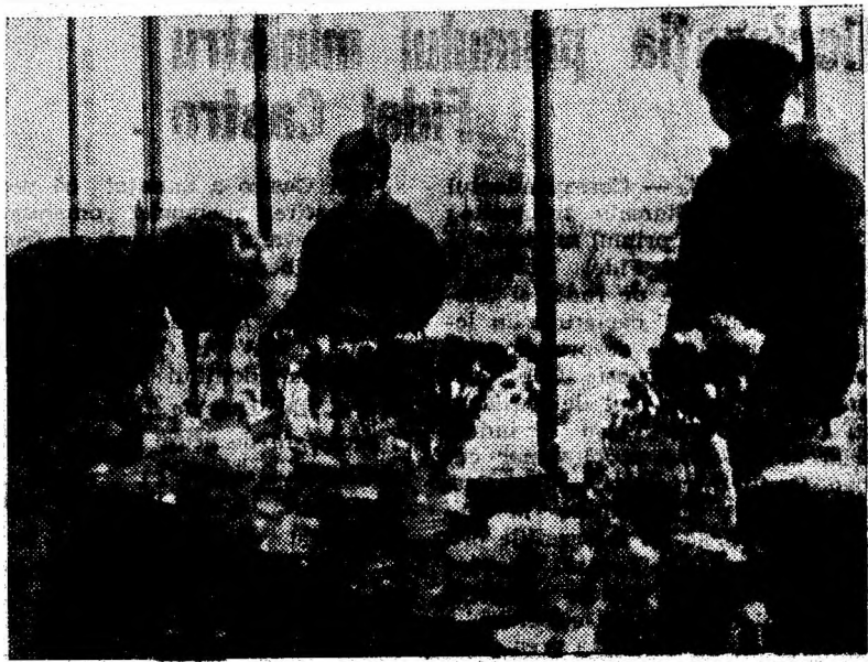
Nu e de mirare că trecătorii cartierului Livezeni se opresc locului în fața vitrinei magazinului cu articole de menaj. Exponatele — variate și gingașe — frumos orînduite în vitrină încintă ochii.

de la O. C. L. Alimentara începînd cu data de 11 octombrie a.c. ■ magazinul de produse lactate situat vis-a-vis de Spitalul unificat din Petroșani. Magazinul și-a îmbunătățit modul de prezentare și desfacere a produselor, punînd la dispoziția consumatorilor produse noi de lactate ca: ■ fructola ■ iaurt extra de calitate superioară Magazinul funcționează în același local, iar orarul său este neschimbat.