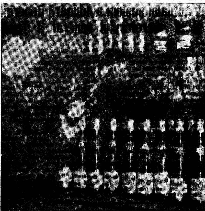
IN CLISEU: Noul Seraficeanu aranjarea rafturilor.

vestitul lăptișor de mătă omogenizat și lăptișor de mătă. Apoi Mercandul — granule cu lăptișor de mătă pentru copii, polen recoltat de al-