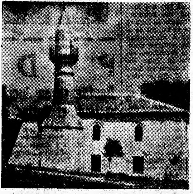
ÎN GDIȘEU: Moscheea lui Esma-Han din Mangalia

Fiind una dintre cele mai vechi construcții de acest fel din țară, geamia a fost renovată, păstrîndu-i-se însă stilul arhitectonic. Ea este vizitată anual de mii de turiști care vin la odihnă în Mangalia sau în celelalte stațiuni de pe litoral.