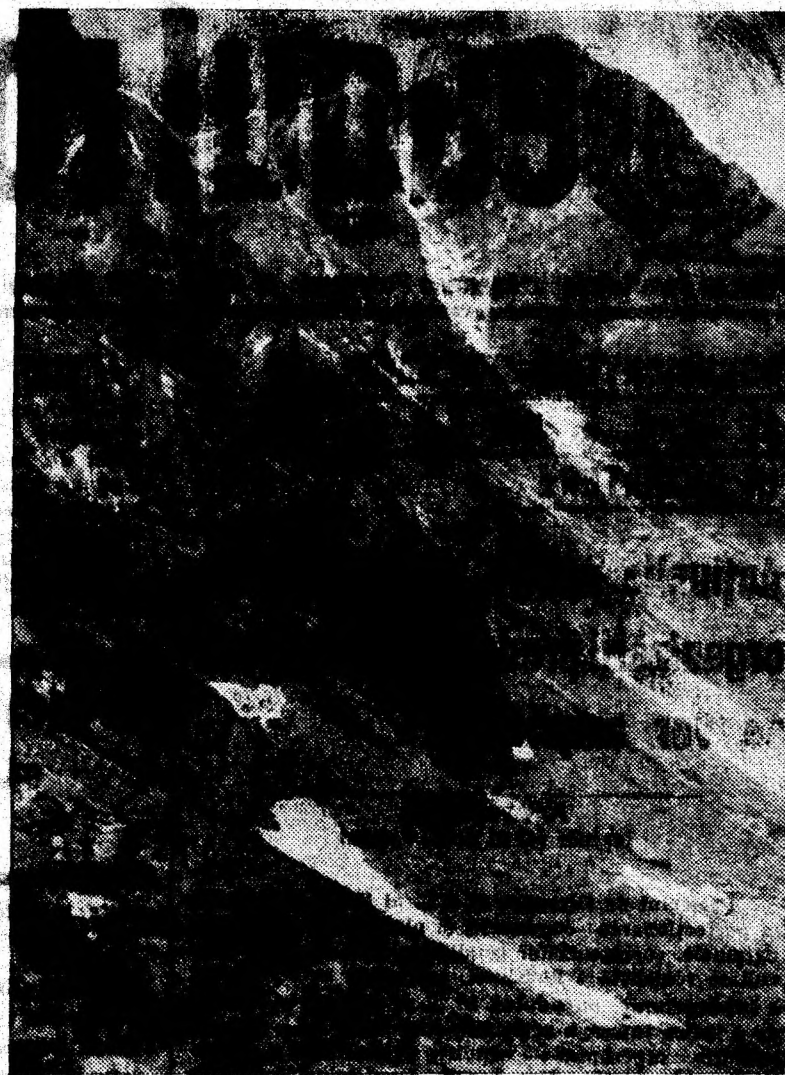
VIRFUL „BUCURA” DIN MUNȚII RETEZAT

Mezi viitoare: Minerul Ghețar — Constructorul Hunedoara; Minerul Teliuc — Minerul Vulcan; Abatorul Hațeg — Știința Petroșani; Preparatorul Petrila — Paringul Lonea; Constructorul Lupeni — Minerul Aninoasa; Minerul Uricani — I.C.O. Hunedoara.