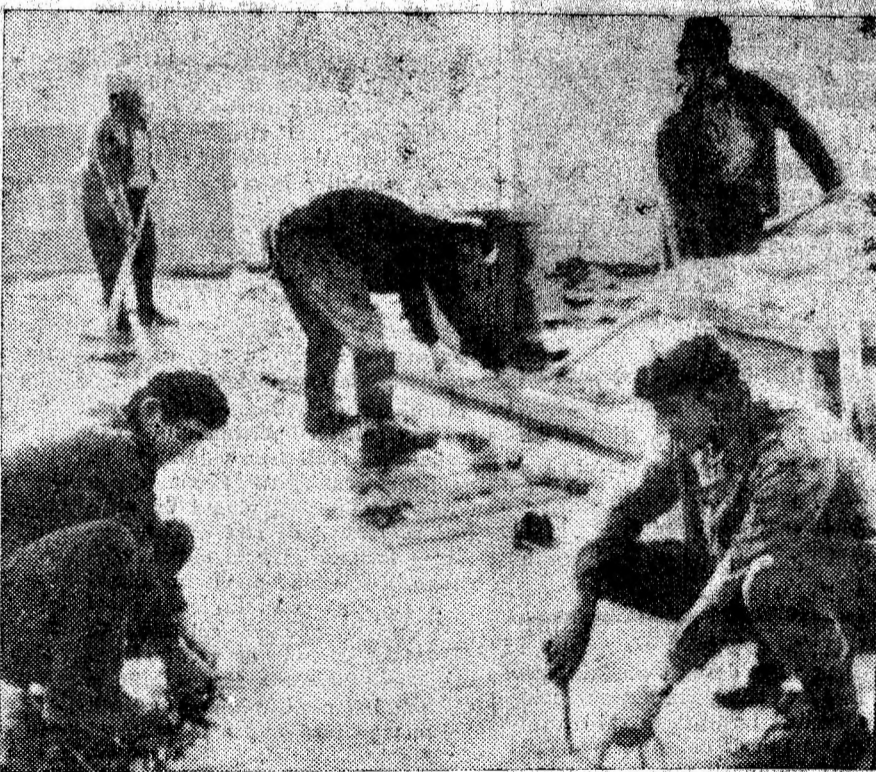
VULCAN: Se execută izolația terasei-acoperiș a blocului F 3 cu 9 etaje

În cele citeva zile care au trecut de la anunțarea înființării lectoratului tehnic s-au înscris 15 categoricieni.