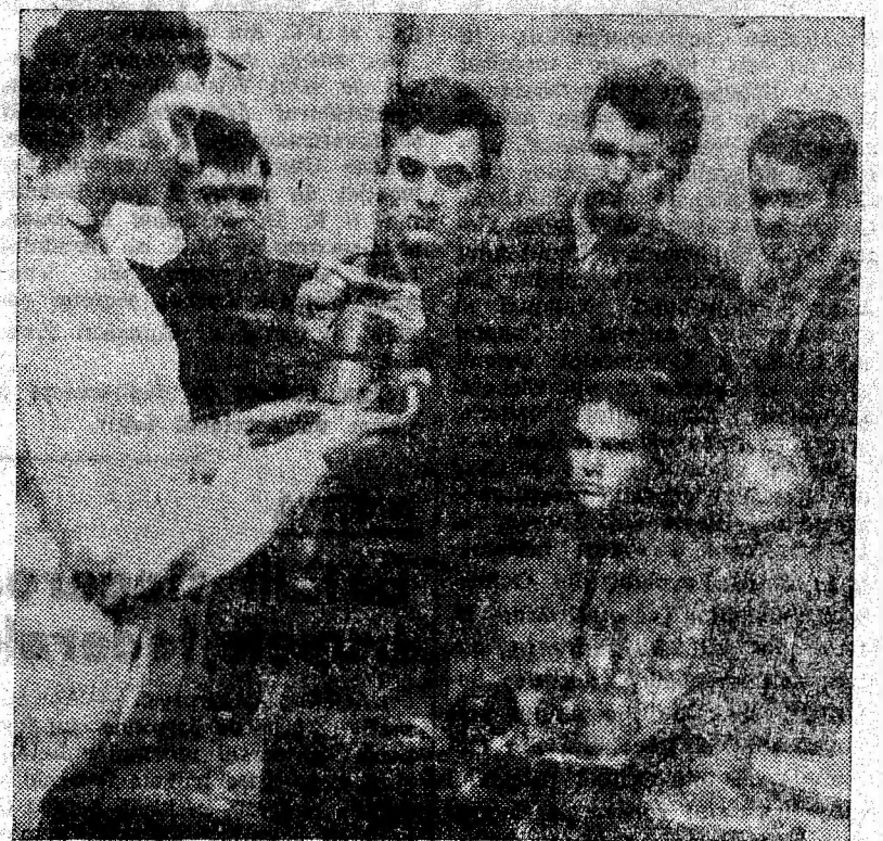
Laboratorul de mașini miniere al I.M.P. Grupa 1144 B, anul IV mine, la oră de laborator.

Noi le-am îndeplinit dorința numiților locatari de pe Calea Brăii. Urmează să le-o îndeplinească și tovarășii de la sectorul I.R.E.H. Lupeni „sfătuiți” de cei de la Petroșani. Oamenii așteaptă.