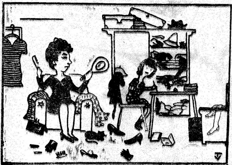
— Mamă, ce vrea să-nsemne proverbul acela cu așchia care nu sare departe de pom? — ?!