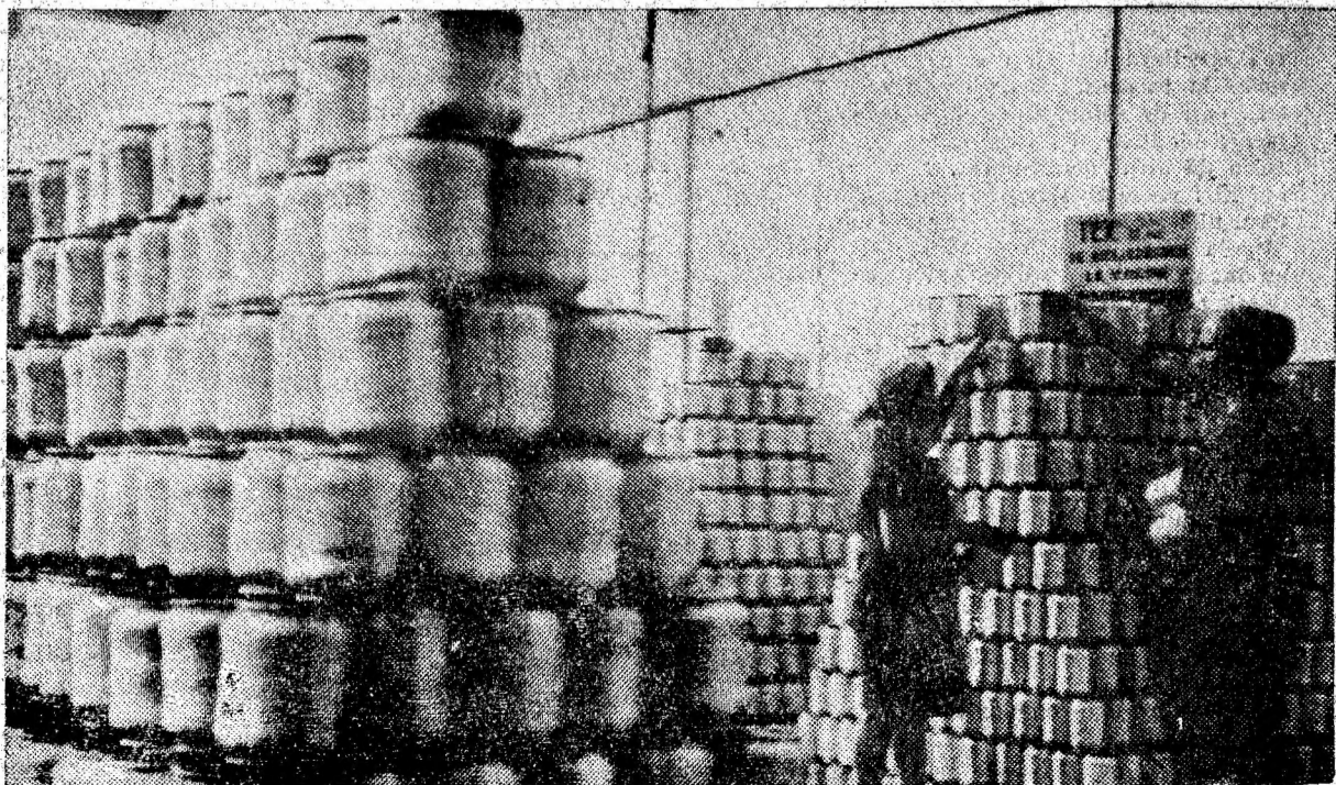
Spive de bobine în subsecția răsucit a F.F.A. „Viscoza” Lupeni. În fiecare 24 de ore aici se răsucește peste 5 000 kg fire de mătase artificială.