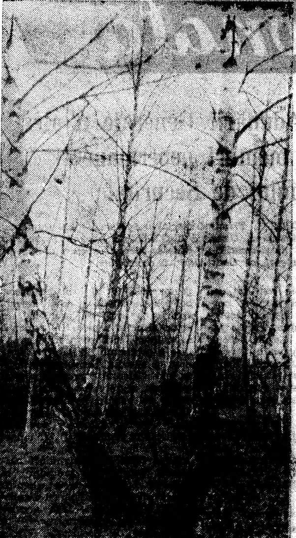
Descoperiți în fața toamnei, mestecenii albi nu prevestesc decît imaculata zăpadă cu care, în curînd, se vor identifica.

● Trei zile la rînd unitatea de lactate din Uricani nu a fost aprovizionată cu produse. A patra zi multe sticle au fost aduse fără capace, încît nu se mai știa care sticlă e cu 2,20 lei și care cu 2,40 lei, iar simțina nu intrunea nici pe departe calitățile ce trebuie să le aibă. Și acest caz nu-i singular la Uricani. El se repetă cam des. Ziarul a mai sesizat asemenea situații la Uricani dar... nu s-a fript nimeni cu iaurtul.