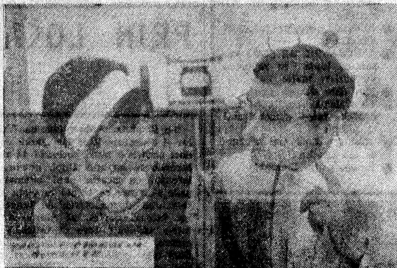
O secvență din filmul „Șeful sectorului suflete”

cărui dragoste posedă, egoistă o depersonalizează, Magdalena își va recăpăta independența începînd o viață nouă, adevărată, fără concesii. Șeful sectorului suflete — un personaj simbolic lesne de descîrnat, cîștiga adeziunea prin ideile nobile pentru care militează: un climat moral sănătos, dragoste și preluire în relațiile dintre oameni, sinceritate și devotament, onoare, demnitate.