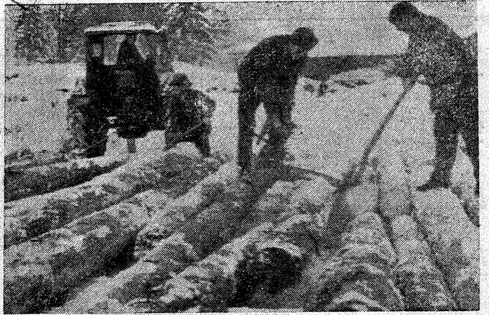
Gaterul din Lonea. Buștenii sînt supuși fasonării.

plus, au sporit productivitatea muncii cu 31 kg cărbune pe post, au redus prețul de cost pe tonă de cărbune cu 4,16 lei, realizând pe această bază o economie la prețul de cost al producției de peste trei milioane lei.