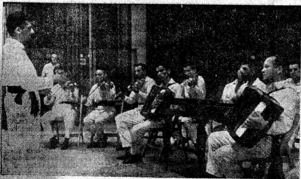
Taraful clubului sindicatelor din Uricani la una din repetițiile săptămînale.

care anunța că sîmbătă după-amiază și duminică dimineața în sala de sport din Lupeni se vor disputa etapele a III-a și a IV-a ale competiției handbalistice dotate cu „Cupa F.R.H.”. Dar întrecerile nu s-au disputat. Cu aproape o săptămîină în urmă aici s-a produs un deranjament la instalația electrică care n-a putut fi remediat în timp de 7 zile. Este și aceasta o dovadă a lipsei de interes ce o manifestă față de sport în general și față de handbal în special liderii mișcării sportive din Lupeni. Oare n-a fost suficient o săptămîină de zile pentru remedierea defectiunii ?