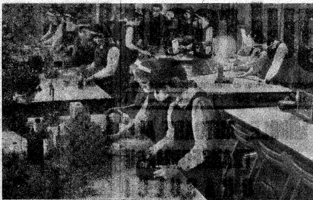
Verificarea practică a veridicității legilor electriceității. Elevii clasei a XI-a B de la Liceul Vulcan în laborator.