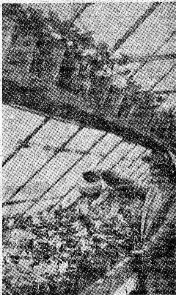
În împărăția florilor, la sera din Petroșani

Economisirea materialului lemnos constituie o sarcină de mare actualitate căreia conducătorii unităților, cadrele de ingineri și tehnicieni, mineri cu experiență trebuie să-i acorde o atenție deosebită.