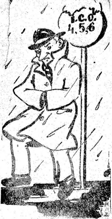
...DE I.C.O. PETROȘANI...