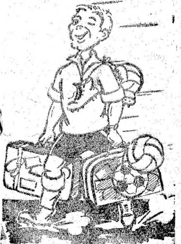
SPRE ALTE... LOCURI MAI CALDE