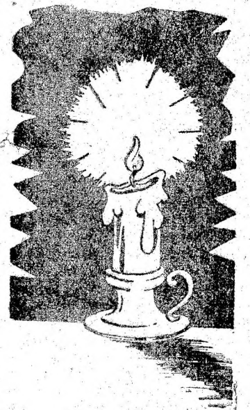
...DE SECȚIA REȚELE VALEA JIULUI A I.R.E.H.