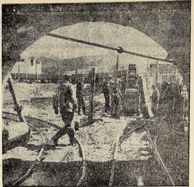
Porta spre adîncurile Paroșeniului.