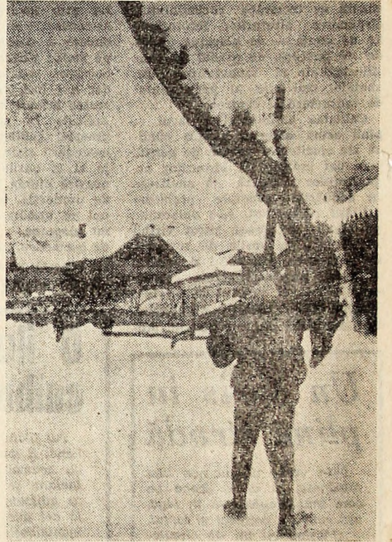
Prieteni de sezon

Analiza secției de fotbal a asociației sportive Jiul Petroșani în care s-au trecut în revistă rezultatele obținute în anul trecut a pus accentul îndeosebi pe lipsuri și ceea ce trebuie făcut încă de pe acum pentru remedierea lor.