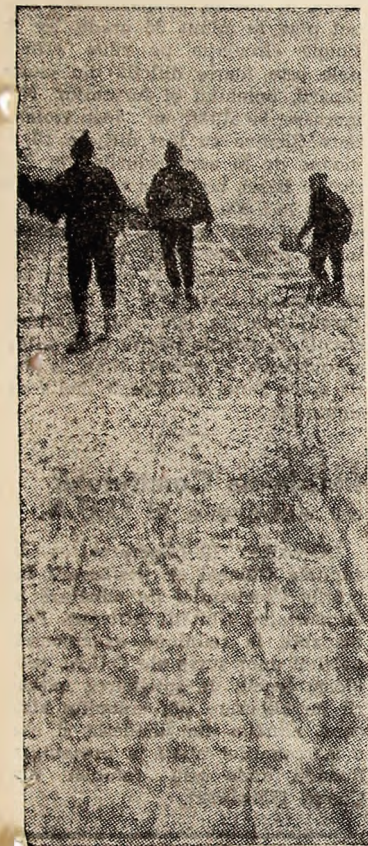
Zăpada pufoasă e numai bună pentru schial și dat cu săniuța.