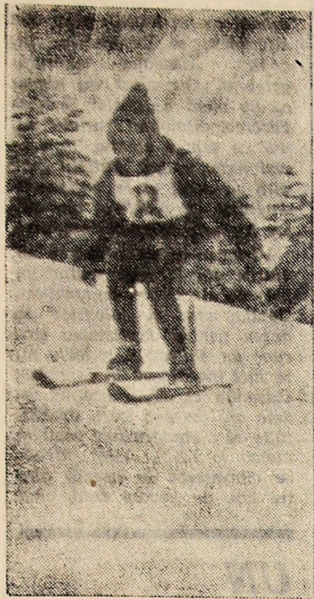
Pirtile de pe dealurile din împrejurimile Institutului de mine sînt asaltate aproape zilnic de schiorii de la Școala sportivă Petroșani. În clișeu: Unul din micii schiori în plin efort.