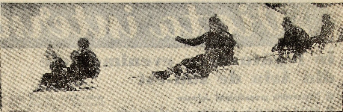
Zboară sănioară, zboară...