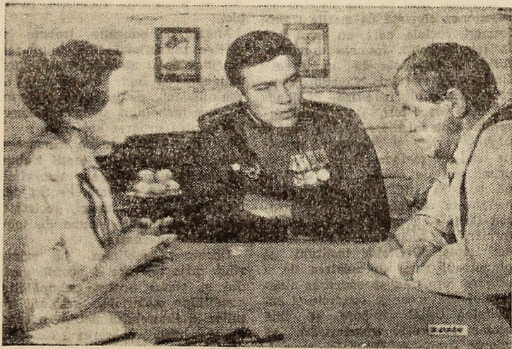
Secvență din filmul Zosia.

Bancnotele false inundă Parisul. Prins și condamnat la închisoare pe viață, Taupin este ajutat să evadeze de către baron care, refugiat în Spania, intenționează să-și continue „meseria” cu ajutorul lui Taupin. Escrocul fără voie va trece granița închis într-un cosciug, într-o mașină mortuară, condusă de un complice... Apoi... Dar mai bine vă lăsați să vedeți continuarea, pe ecran!