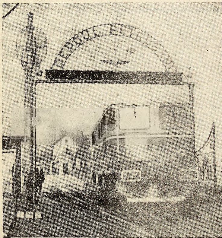
Gata de plecat în cursă, pe drumul de ner