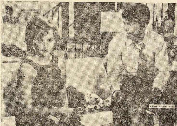
O secvență din filmul „Cînd tu nu ești”.

În rolul principal apare cîntărețul Raphael, considerat Gianni Morandi al Spaniei.