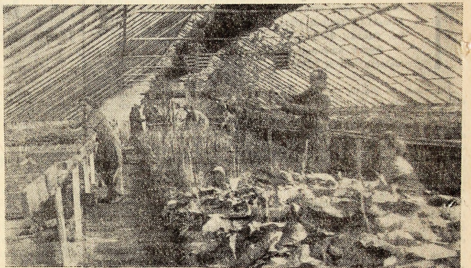
Pregătiri de primăvară la sera din Lonea

Există jargonuri internaționale vorbite de oameni de diferite naționalități. Sînt dialecte amestecate, alcătuite din cuvinte din diferite limbi și care nu au gramatică. Astfel, în Africa de vest se vorbește „engleza stîrcată” (broken English). Marinarii care navighează pe Oceanul Pacific se înțeleg într-un jargon alcătuit din cuvinte englezești, dar conținînd elemente de gramatică chineză. Jargonul folosit în insulele Oceanului Pacific a devenit limba vorbită a populației din nord-estul Noii Guinee. Pe insulele din Mediterana este răspîndit jargonul sabir, care conține cuvinte din limbile franceză, greacă, italiană, arabă, dar în care gramatica acestor limbi s-a pierdut.