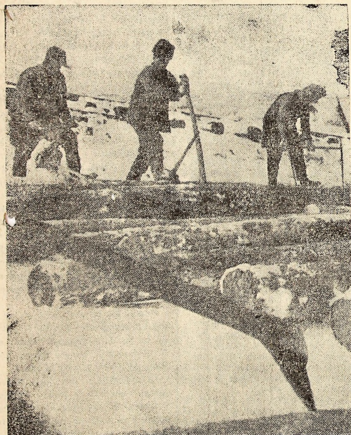
La Valea de Pești, pe rampa exploatarei forestiere Arcanul, se pregătește un nou transport de busteni.