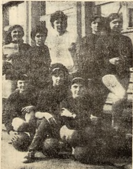
ÎN CLIȘEU: Echipa de fete a Liceului Vulcan, campioană școlară a Văii Jiului pe anul 1968.