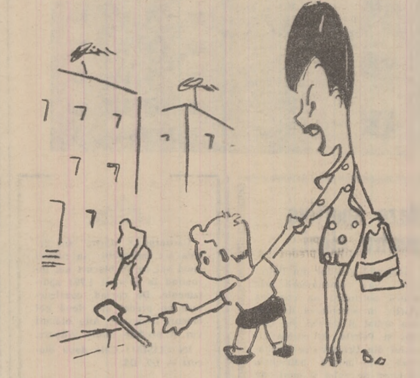
DUMNEAEI: Las-o-o! L-ai văzut fu vreodată pe făcu pînă la mîna pe lopală?!

Săptămîna primăverii s-a desfășurat în cadrul tuturor școlilor generale din Lupeni cu mult entuziasm. Comandanții unităților de pionieri au mobilizat elevii din clasele V-VIII la acțiuni de amenajare și înfrumusețare a terenurilor din jurul școlilor și a spațiilor publice stabilite în prealabil. Pionierii de la Școala nr. 1 au amenajat parcul pionierilor, cel de la Școala nr. 4 dealul din fața mîinii. Școala nr. 3 a amenajat un teren de circa 800 mp în spațiile blocurilor B 5, B 6 și H destinat pentru joaca copiilor. De asemenea, s-a amenajat curtea Școlii nr. 8 din Braia și este în curs de amenajare baza sportivă „Tineretului” unde se vor imprăștia 20 camioane de zăură.