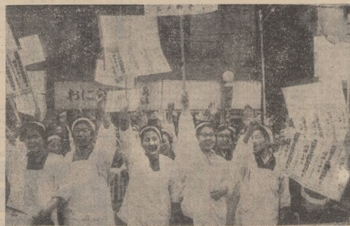
JAPONIA. — Aspect din timpul unei recente demonstrații a femeilor din Tokio împotriva construirii unui spital de campanie american.