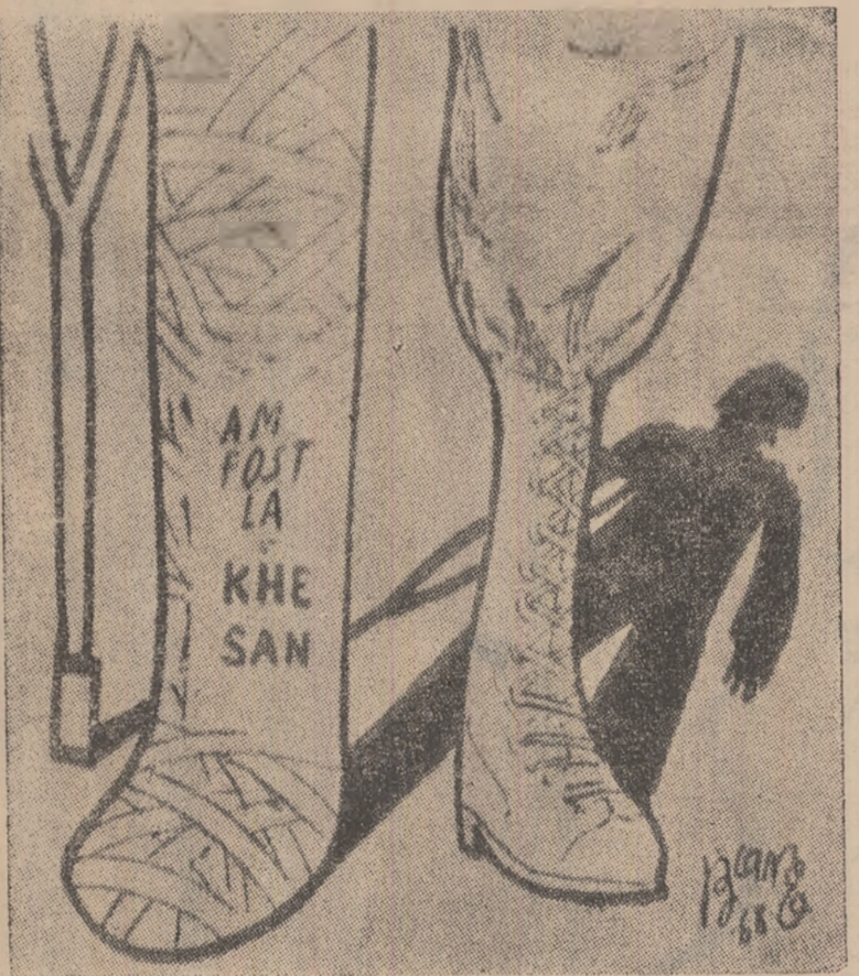
— „AM FOST LA KHE SANH” — se intitulează caricatură apărută în ziarul National Guardian și care nu face decât să ilustreze eșecul înregistrat de militarismul american în Vietnamul de sud, eșec ce poate fi apreciat și după numărul răniților evacuați de aici.