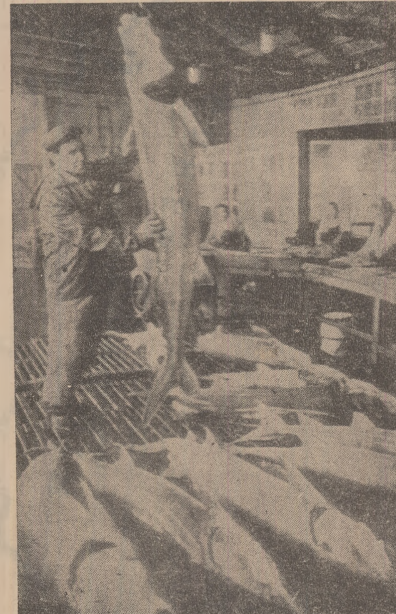
Tiparul: I.P.H. Subunitatea Petroseni 40 369

BELGRAD. — După cum anunță agenția Tanjug, joi dimineața în zona de vest a Macedoniei s-a produs un puternic cutremur de pământ. Cutremurul, care a avut o intensitate de gradul 6—7, a produs panici în rândul populației, care a părăsit locuințele leșind în stradă. S-au înregistrat pagube materiale. Cutremurul de joi a fost cel de-al 1253-lea înregistrat în zona orașului Debar, care a avut de suferit de pe urma mișcărilor seismice din 30 noiembrie anul trecut. Potrivit părerii specialiștilor, aceste mișcări seismice durează în zona epicentrului mai mult ani pînă se calmează.