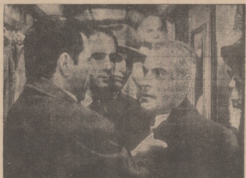
O secvență din filmul „Cea mai lungă noapte”.

vor încerca să-l salveze, aceasta va fi „cea mai lungă noapte”. Un fărîm, o doctoriță, un tată cu copilul său, plecați să găsească de lucru la Sofia, doi îndrăgostiți, un revoluționar ieșit din închisoare și un iluzionist vor simți fiecare, pe rînd, frica și curajul, dar, pînă la urmă, vor fi mîndri că au învins, reușind să-l ascundă pe prizonier de urmărirea fasciștilor. Cînd avioanele americane apar și totî părăsesc trenul, ofiterul englez... Dar, mai bine, vă lăsați să urmăriți continuarea pe ecran.