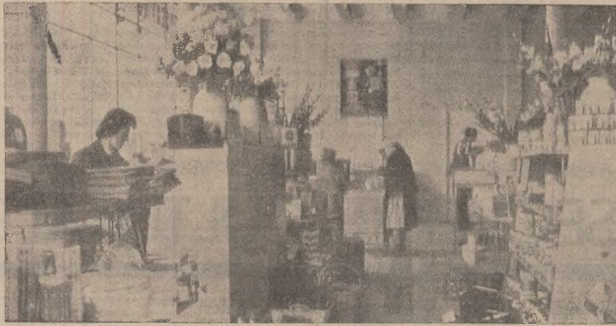
O unitate bine aprovizionată, cu mărfurile frumos aranjate — magazinul pentru articole de menaj din cartierul Livezeni.