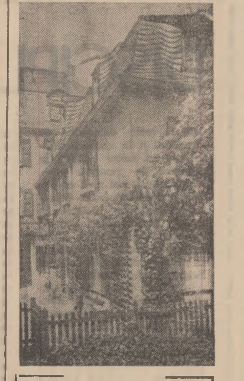
R. F. A. GERMANIEI: Lu prima vedere o căsuță cu multe altele... În spatele acestor ziduri a creat însă muzica sa nemuritoare Ludwig van Beethoven la Bonn.