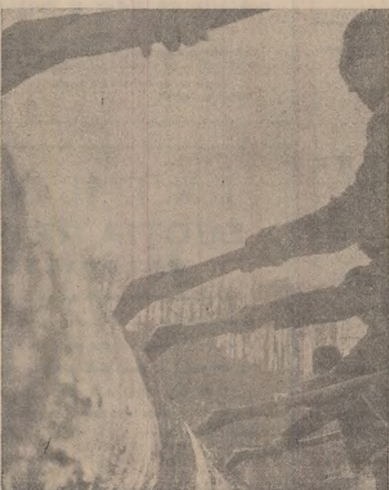
Rampa de încălzire Rostoveanu de la Cîmpu lui Neag. Buștenii din parchetele forestiere din jur ajung aici transportați cu funicularul. Iar apoi iau drumul fabricilor de prelucrare.

melor puse de construcția noului pod, constructorii de drumuri au ridicat ziduri de sprijin înspire partea Jiului, au înălțat patul șoselei cu 3 m. În prezent el lucrează la rectificarea traseului drumului în dreptul podului ceea ce face necesară tăierea unui pînien de piatră pe o adîncime de 28 m în munte, față de vechiul ax al șoselei.