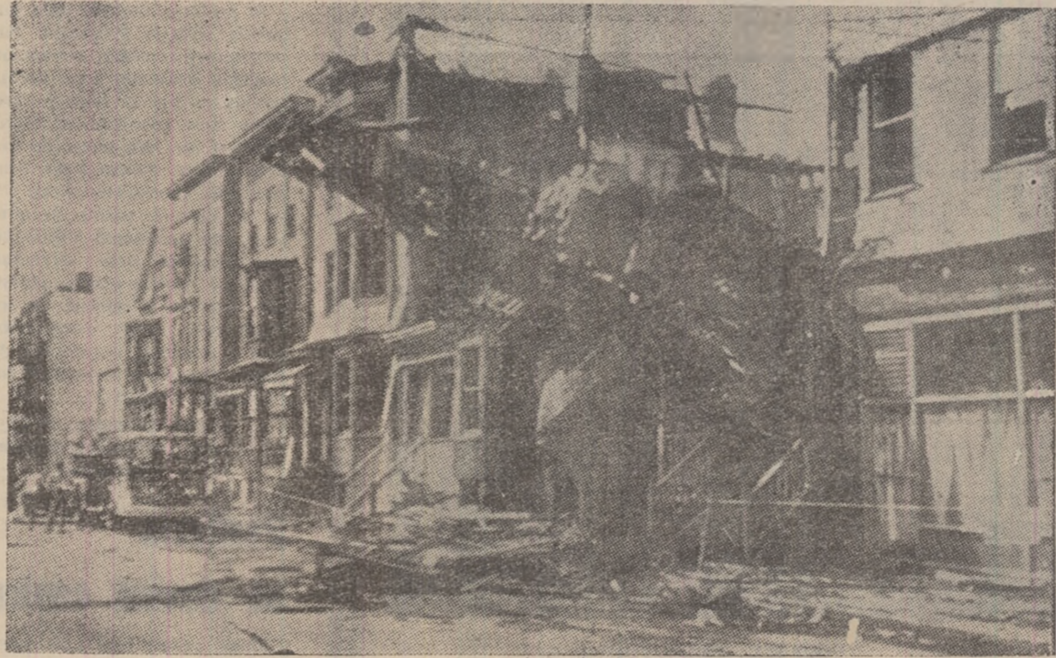
In urma incidentelor cu caracter rasial în multe orașe din S.U.A. s-au înregistrat mari pagube materiale. ÎN CLISEU: Case incendiate în cartierul negru din Newark, New Jersey.