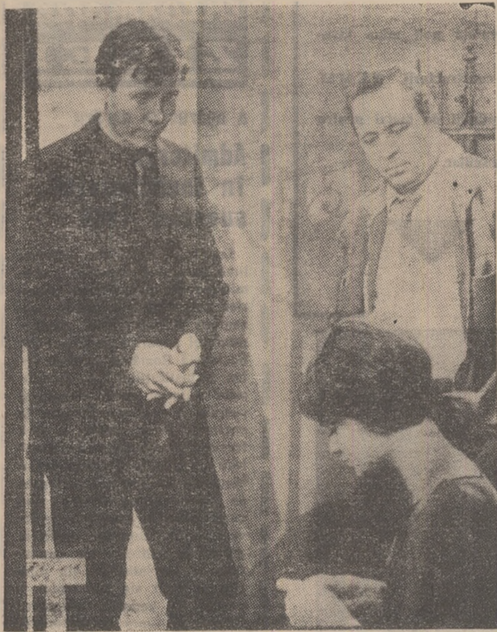
O secvență din filmul de mare tensiune „Moartea după cortină”.