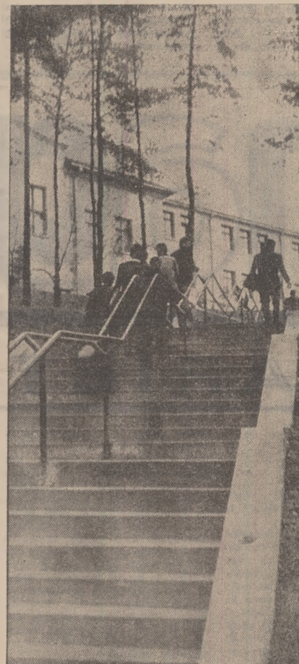
Urcuș spre „cetatea luminii” — Institutul de mine Petroșeni.

La termocentrala Paroșeni a intrat în funcțiune, joi după-amiază, un nou obiectiv. Este vorba de noua stație de gaze dotată cu aparatul modern de reglare automată. Prin intrarea în funcțiune a noul stații, la carel capacitate este de 60 mil metri cubi gaz/oră, se îmbunătățesc condițiile de livrare a gazului și crește simțitor siguranța de exploatare a termocentralei.