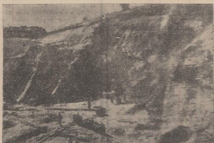
Aspect inedit din timpul primelor lucrări de exploatare a cărbunelui la mina Vulcan, efectuate în Valea Plezițoare.

Legarea Văii Jiului de Transilvania, prin calea ferată ce s-a construit în anul 1867-1870, a dat un nou impuls extracției cărbunelui din Valea Jiului.