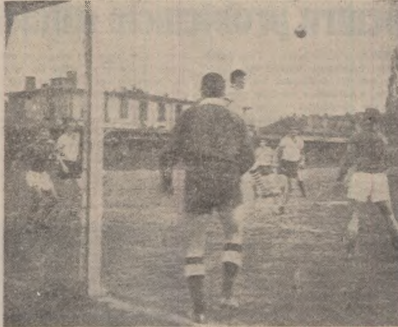
Un nou corner la poarta oaspeților.