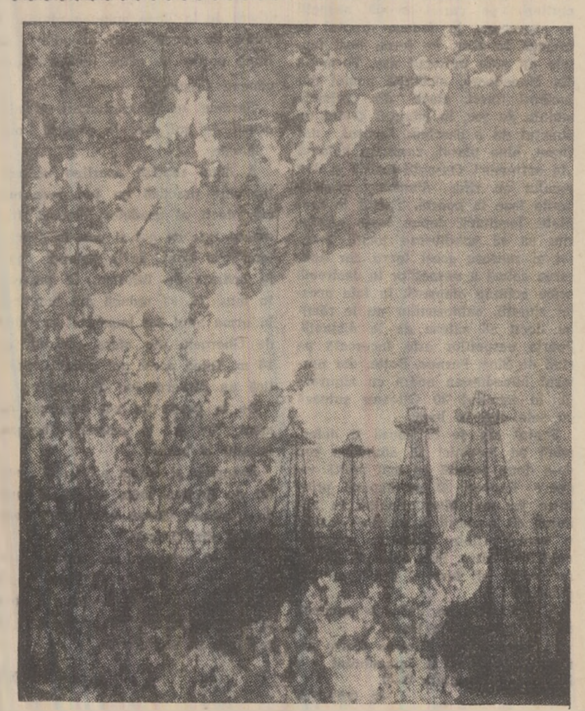
Scheletul Bâlcu în timpul cîștirilor în floare.