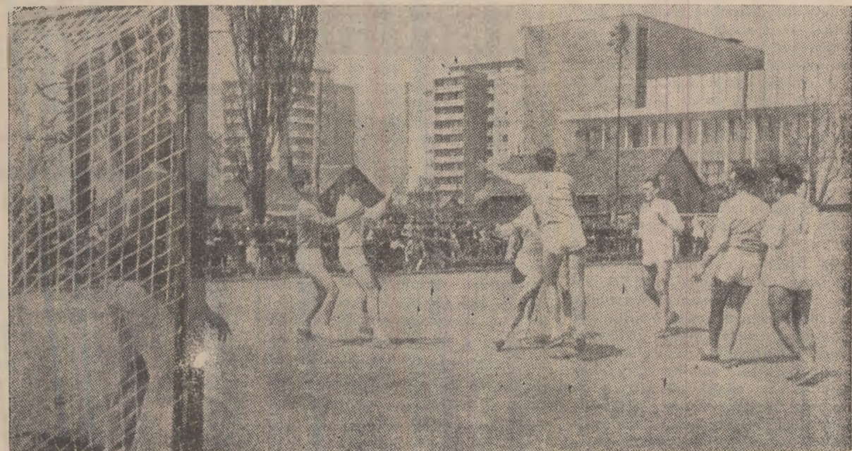
Știința se ață în atac. Cîteva pase și mingea va poposi din nou în poarta oaspeților.