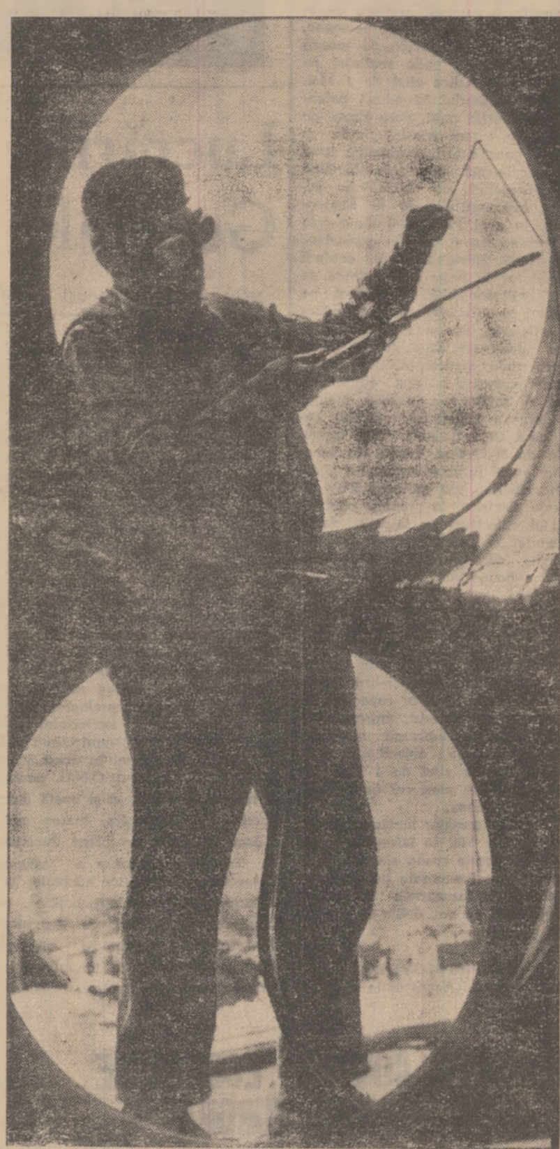
Mîini dominice de muncitor unesc ermetice, prin sudură, tuburile de aeraj adînc de necesare muncii în adîncurile minelor.

Da, mineritul Văii Jiului poate face acum retrospectiva unui secol, în care ultimii douăzeci aparțin epocii glorioase a construcției socialiste.