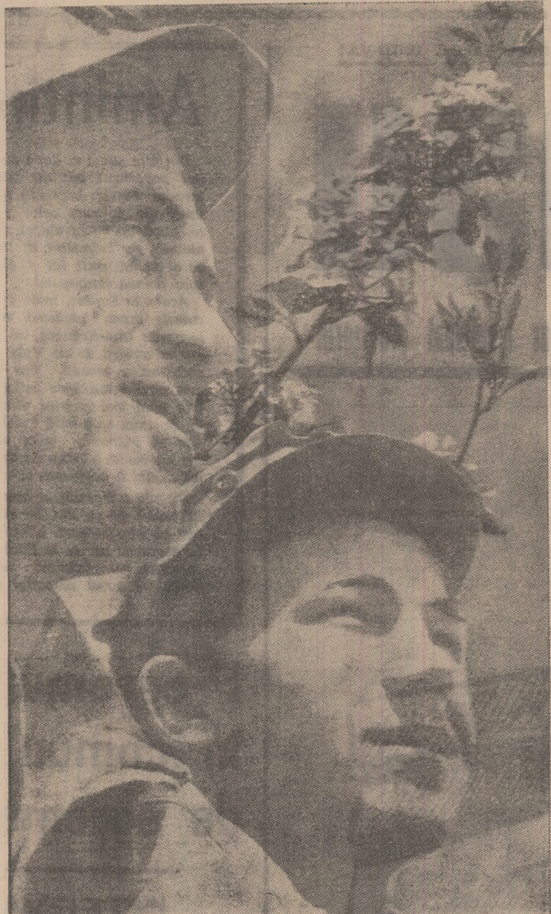
VIGOARE ȘI GÎNGĂȘE.