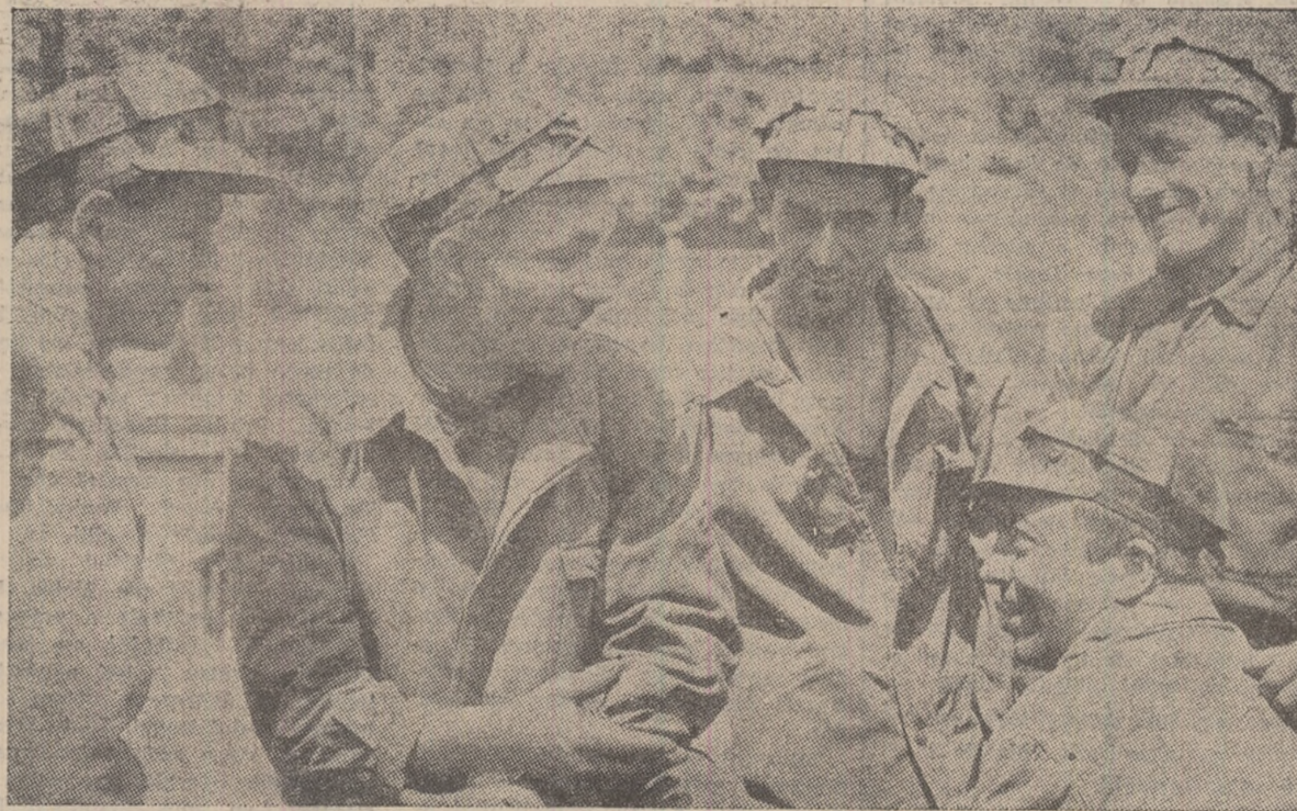
Sfat între orlaci înainte de a pleca în subteran (mineri din sectorul V al minei Lupeni).