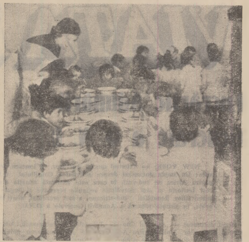
Ora mesei la Căminul de zi al O.C.I. Produse industriale din Petroșeni.

E necesară deci urgentarea lucrărilor la secția înghețată, imbutelierea de lăut în borcane mici, transportarea operativă a ambalajelor și o mai mare atenție igienei în fabrică și în unitățile de destacare.