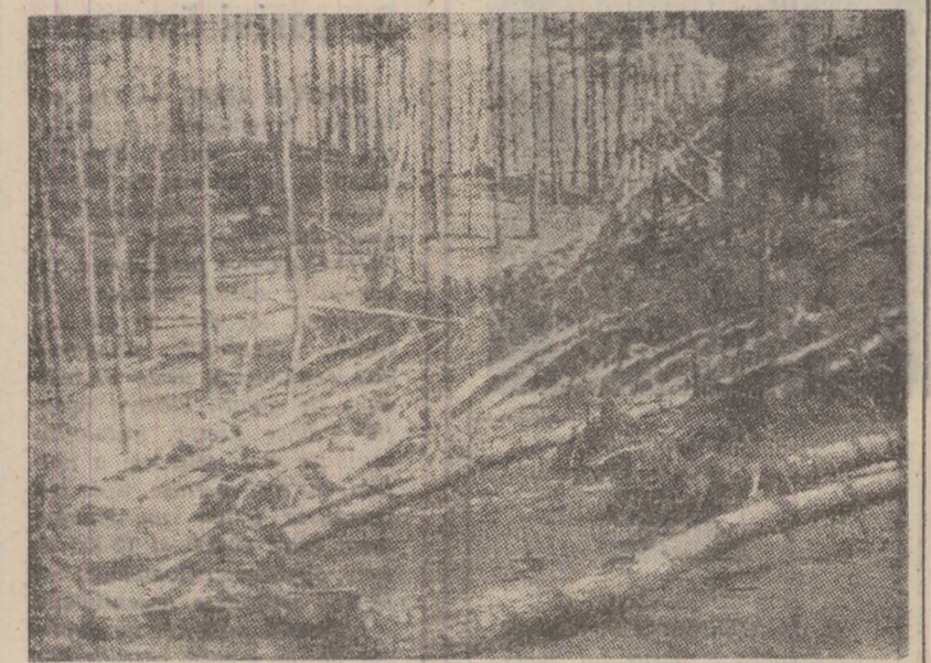
Arborii doborîți de vînturile și zăpada din timpul iernii în pădurea de lîngă institutul de mine, așteaptă mina gospodărilor de la Ocnița silvic Petroșeni care să-i valorifice.