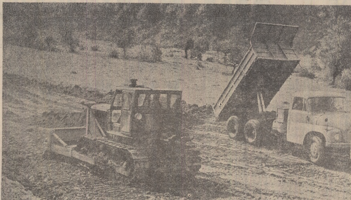
Lucrări de amenajare în incinta minei Livezeni.