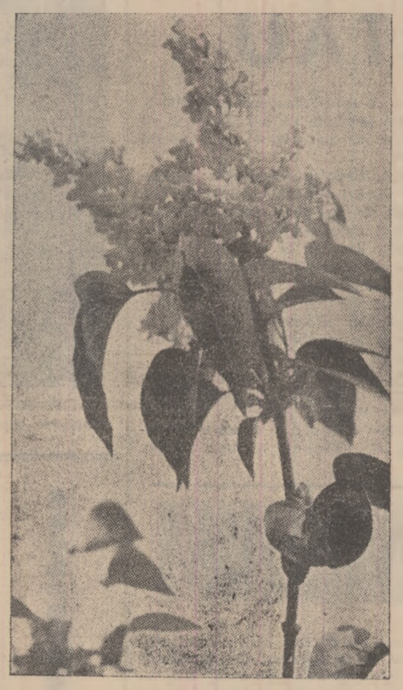
Ramură de floare sărbătorită de oameni, în zilele primăverii, în multe locuri termostate din țara noastră.