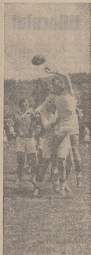
Una din fazele mai clare, mai puțin distructive, oferite de rugbiștilor petroșani.