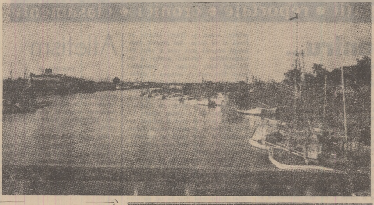
REPUBLICA CUBA. In portul pescăresc Las Casas ambarcațiunile așteaptă să plece în larg.